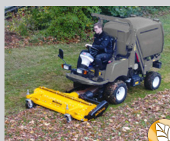
Ramassage des feuilles en automne