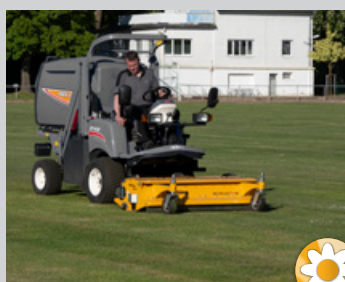
Scarification au printemps