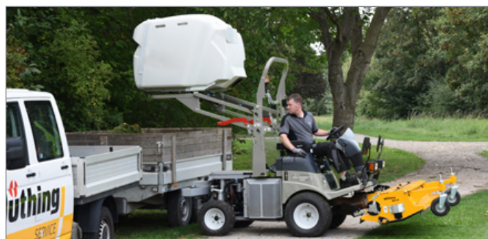
Le système MU-Vario® de série assure un broyage parfait et accroît la capacité de chargement.