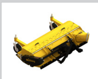
Triangle d'accouplement Cat. 0