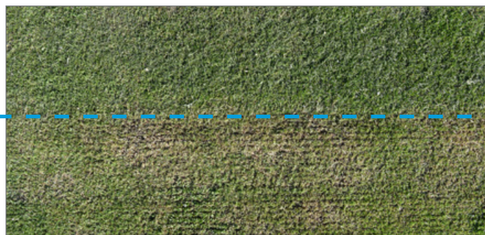
Grâce aux couteaux rotatives, la couche de tapis végétal est taillée et aérée de manière ciblée dans la zone du collet des racines (image en haut : avant scarification, image en bas : après scarification).