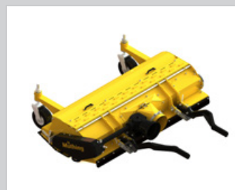
Console de montage pour bras porteurs